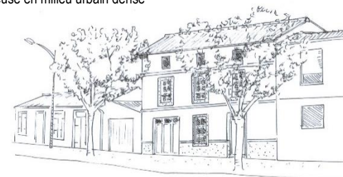
Après Maison de faubourg en R+1 + combles aménagés

Exemple de la densification d'une dent creuse en milieu urbain dense