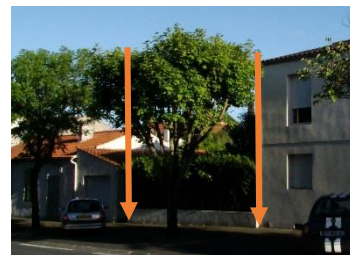
Avant Jardin en bordure de rue

Exemple de la densification d'une dent creuse en milieu urbain dense